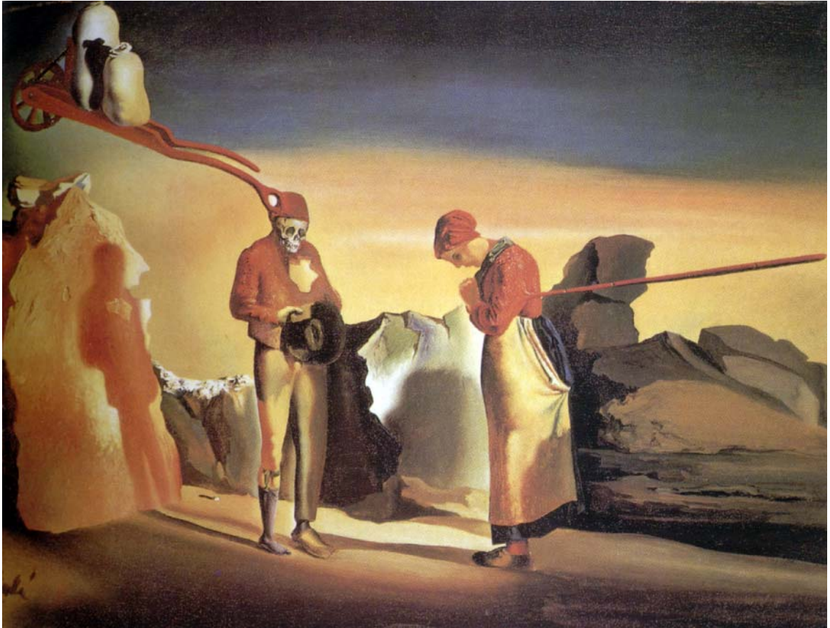
Atavismo do crepúsculo