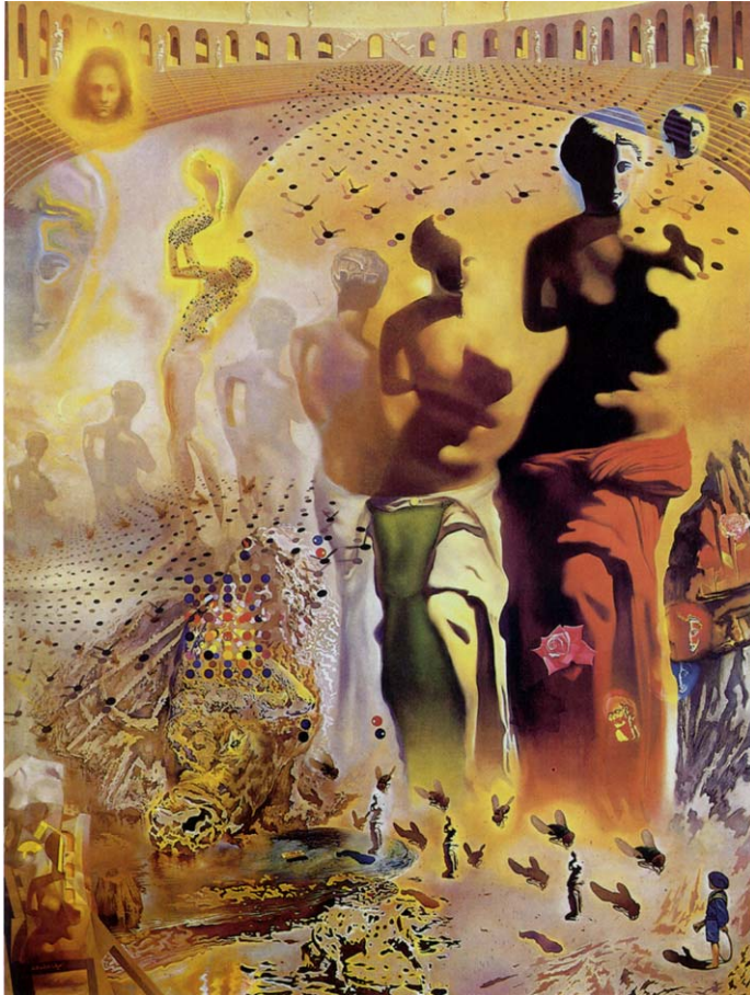
O Toureiro Alucinógeno