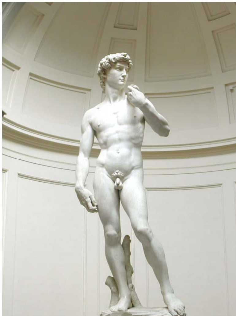
O David Museu de La Accademia, Florença Michelangelo Buonarrotti

A técnica que Michelangelo usou nas pinturas da mais famosa Capela, foi o Afresco. O artista aplicava duas camadas de gesso sobre a superfície a ser pintada. Depois, uma nova camada de gesso úmido era colocada, mas só na área que seria pintada no dia. A tinta utilizada sobre o gesso úmido reagia e ficava com cores mais nítidas e também oferecia uma maior durabilidade. As cores usadas eram claras e brilhantes, no entanto a poluição e o tempo escureceram toda a pintura. A Capela Sistina começou a ser restaurada em 1980 sob o patrocínio, excelente ação que deve ser divulgada, da Nippon japonesa. O trabalho, que Michelangelo fez sozinho em 4 anos, precisou de vários artistas e a mais moderna tecnologia para ser recuperado e necessitou 12 anos de esforço.