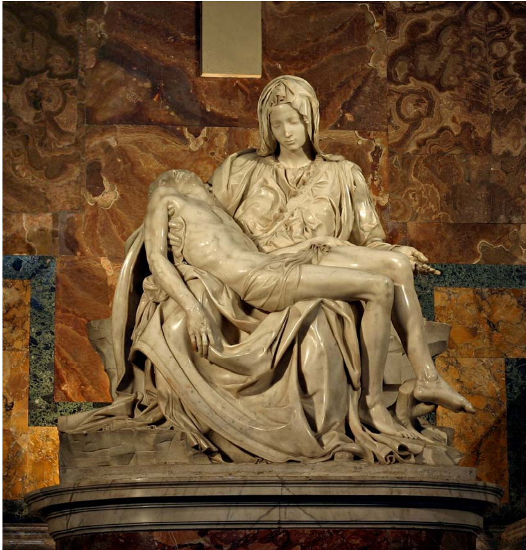
A Pietá Basílica de São Pedro, Vaticano Michelangelo Buonarroti

No trabalho da Capela Sistina, Michelângelo primeiro fazia um desenho, passava o desenho para a parede então pintava. Estes desenhos foram coletados na Casa Buonarroti, um museu em Florença onde era a moradia da família de Michelângelo.