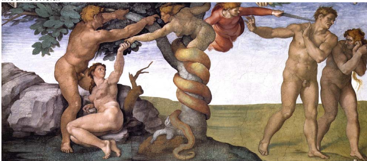
Adão e Eva

A Capela Sistina é assim chamada porque foi construída pelo Papa Sisto VI. Foi decorada por pintores renascentistas importantes, como Botticelli, Perugino, Ghirlandaio e Signorelli. O Papa Julio II contratou Michelangelo para pintar o teto da capela. A princípio ele recusou, porque preferia esculpir. Algum tempo depois, como que iluminado, aceitou a incumbência.