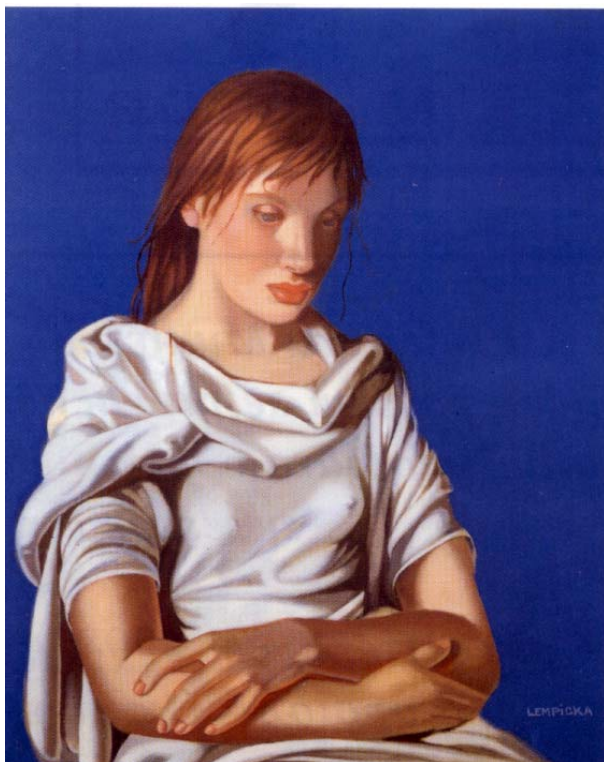
Lempicka Lady in Blue, 1939

Tamara de Lempicka Nasceu em Varsóvia em 1898. Ela se tornou uma bela mulher. O desejo de ser uma pintora apareceu durante uma viagem pela Itália. A sua pintura não pode ser classificada em uma das correntes que se desenvolveram no período entre as grandes guerras. Viajou pelo Surrealismo, Cubismo e a arte abstrata, mas a pintura figurativa era a sua expressão. Sempre viveu no mundo abastado e usou a saúde financeira para obter liberdade. Era antes de tudo uma mulher livre.