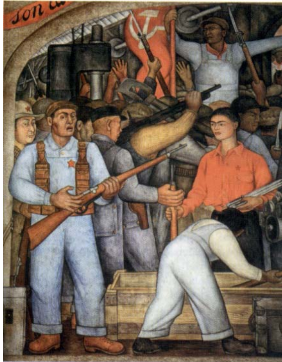
Rivera Frida Kahlo Distribuindo Armas, Mural

Diego Rivera nasceu no México em 1886. Ligado ao partido comunista recebeu Trotski em sua casa. Amigo de André Breton, um dos principais pensadores franceses. Ilustrou o Canto General de Pablo Neruda. Casou-se com Frida Kahlo, pintora. Rivera e Kahlo além de artistas foram admiráveis por seus valores e coragem. A pintura mural de Rivera é única no mundo.