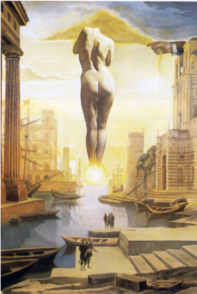
A Mão De Dali Retirando Um Tosão De Ouro Em Forma De Nuvens Para Mostrar A Gala A Aurora Toda Nua Muito Longe, Longe Do Por Do Sol.

Salvador Dali Nasceu em Figueres, na Catalunha em 1904. Para representá-lo basta uma palavra, genialidade!